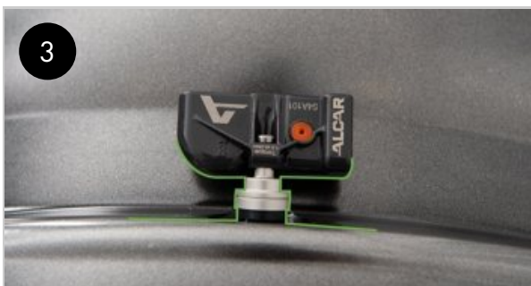
3 Nutná minimální vzdálenost mezi čelem snímače a ráfkem.