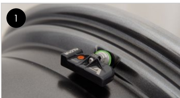
1 Kontakt mezi těsněním a ráfkem. Těsnění musí být na úrovni kapsy ventilu.

Dbejte pokynů výrobce a vždy se jimi řiďte! Montáž mohou provádět pouze proškolení odborníci.